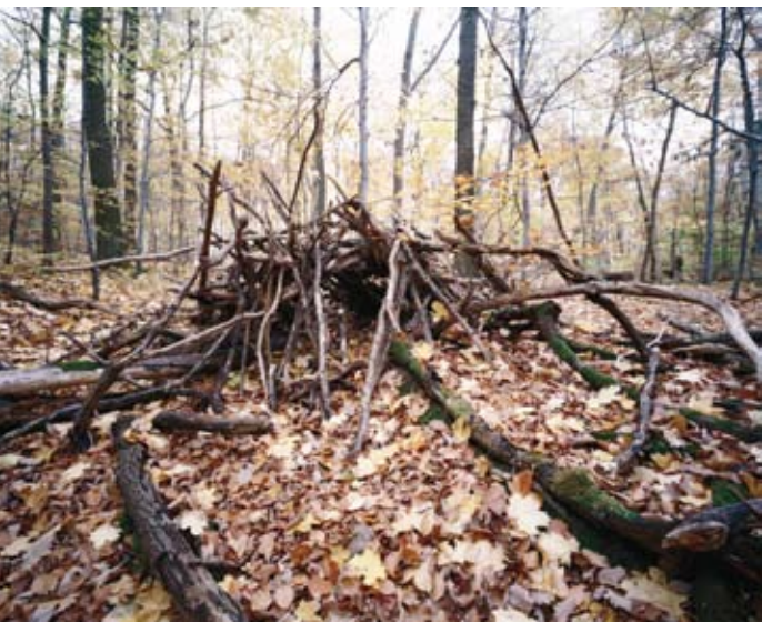
[ 16 ]