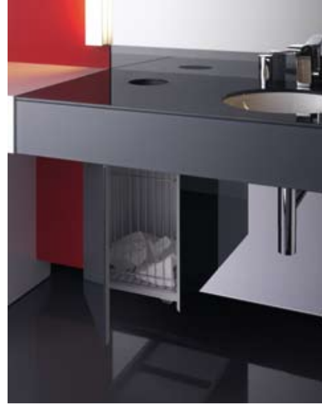
[ 32 ]