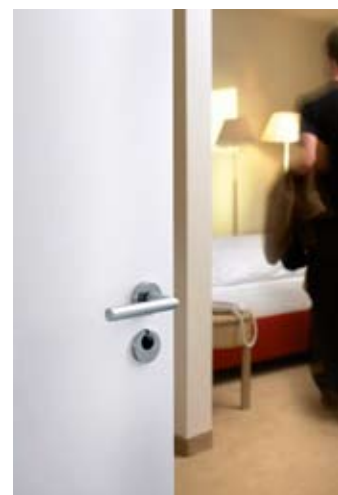
[ 24 ]