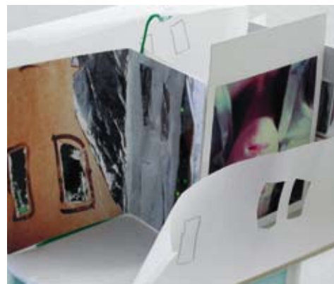
[ 40 ]