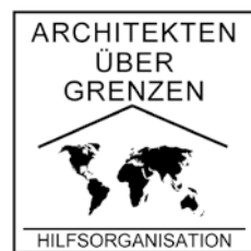
[ 31 ]